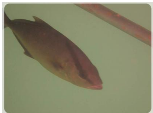
Et toi, qui es tu, comment tu t'appelles ?