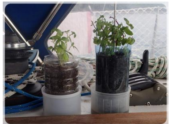
culture illicite ou pas... ça nous occupe !

- Jeudi 24 mai 2018 : le beau temps revient, avec encore quelques averses pour ce matin, Mais on sèche aussitôt que la pluie cesse. Nous partons faire la randonnée de la presqu'île de la Caravelle. Environ 10 km.