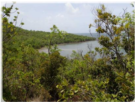
La Baie Gros Raisins

Nous redescendons le morne par ce sentier providentiel pour enfin arriver à la Baie de Gros Raisins.