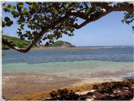
Baie de Grosjean

Nous continuons notre chemin en descendant un sentier bien cabossé. Les bonnes chaussures sont de rigueur. La chaleur commence à peser sur nos épaules mais le paysage vaut le détour et l'effort est récompensé. Seule ombre au tableau une fois de plus, les sargasses qui empestent certains endroits et la pollution générée par les pêcheurs avec leur bidons flotteurs et les vieux filets jetés à la côte .