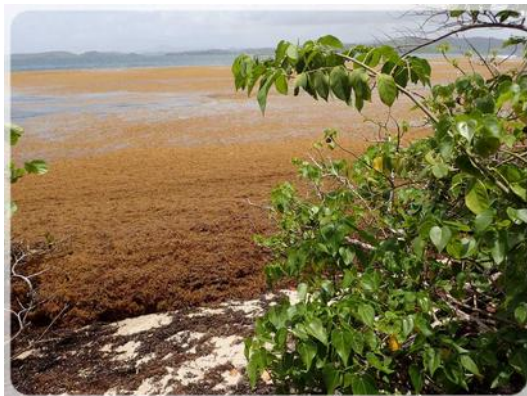
Invasion des sargasses, fléau des plages !

Certains endroits de la baie sont envahies par les sargasses qui dégagent cette odeur pestilentielle d'œufs pourris. Ne restons pas ici, allons observer nos crabes et nos Bernard l'ermite dont certains préfèrent utilisés les vestiges de la pollution humaine à la place d'un coquillage comme habitat !