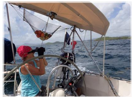
... en surveillant la proximité des cayes.

Là encore, pas un voilier en vue. Nous sommes seuls, le Malumau ancré par 6 m de fonds de sable de bonne tenue, en face l'ancienne sucrière « Habitation Blin ». La baie semble préservée des sargasses. Tant mieux, car cela devenait un problème au quotidien là où nous étions précédemment. Tout simplement, en aspirant l'eau de mer servant de chasse d'eau, la pompe des WC était tombée en panne.