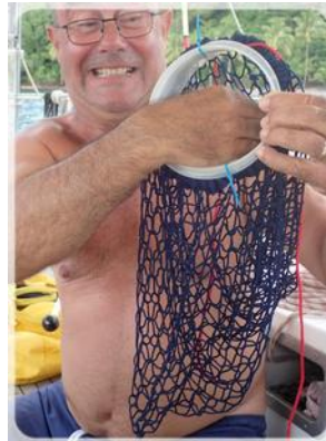
avec un clapet anti-retour Tupperware !!!