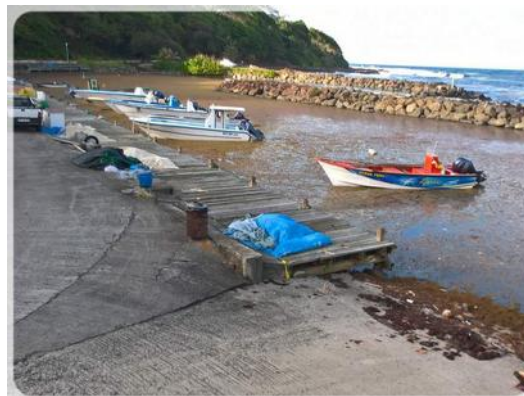
même dans les petits ports de pêche...

Samedi 12 mai 2018 : randonnée de 8 km à partir de notre mouillage. Nous partons de bon matin en direction du Morne Pavillon. Cliquer ce lien pour voir la rando: https://www.openrunner.com/r/6953528