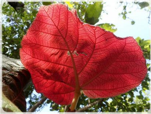
Feuille naissante de Raisiniers