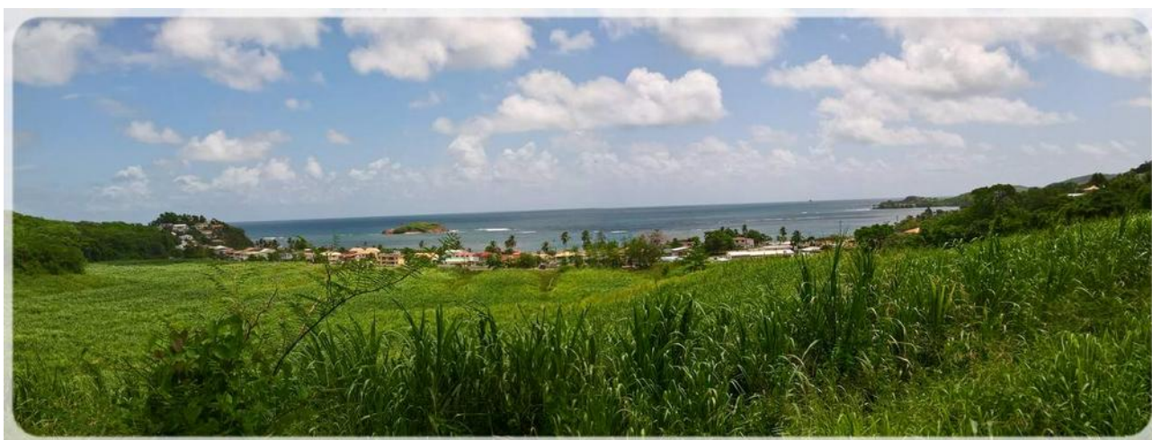
Tartane vu des champs de cannes à sucres situé dans les hauteurs.