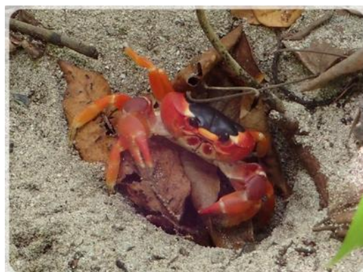
Crabe de mangrove ou crabe touloulou

- Du Samedi 5 au mardi 8 mai 2018 : le mouillage où nous sommes est vraiment calme. Nous apprécions cette tranquillité reposante, baignés dans cette nature vivifiante, sans voiture, sans béton, sans bruit artificiel, seulement la respiration du vent et le chant des oiseaux. Comme si cela était bénéfique à notre équilibre, presque une forme d'addiction. Le plus proche signe de vie se situe à 2 km, la base nautique de Spoutourne. Le week-end, parfois, des amateurs de ski nautique viennent nous perturber. Mais il en faut pour tout le monde. Nous ne sommes quand même pas misanthrope.