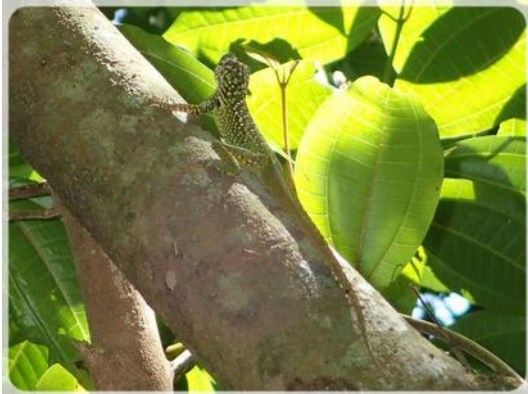
Anolis dans la lumière matinale.