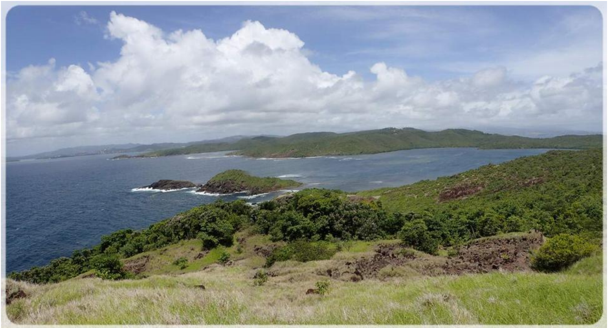
La Baie du Trésor.

Nous confirmons que le circuit est vraiment chouette et qu'il fait partie des incontournables de la Martinique.