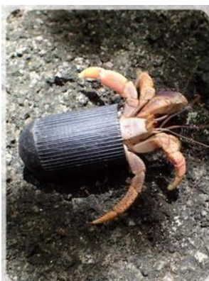
Il est pas beau mon "tube" ?