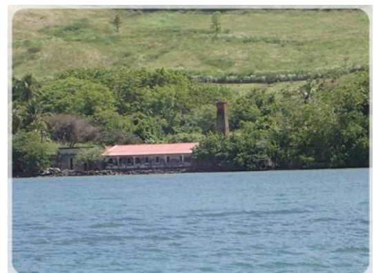
L'Habitation Blin, ancienne sucrière.