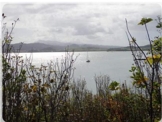
Seul dans la Baie du Galion !

Le temps est toujours mitigée, éclaircies, nuages, averses, surtout la nuit. À tel point que nous utilisons très peu le dessalinisateur car nous récupérons entre 20 et 40 litres d'eau de pluie tous les jours couvrant ainsi nos besoins.