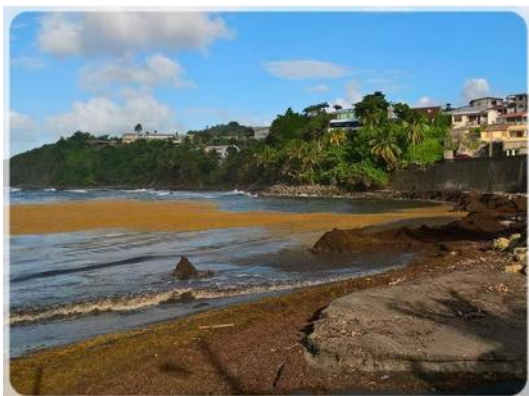
Invasion des sargasses sur les plages