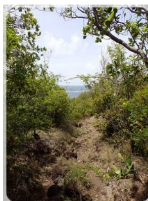
Le petit chemin 🎵 🎵 🎵