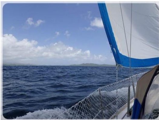
Route vers la Caravelle...