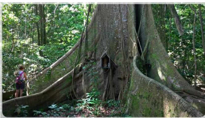
Au pied des contreforts rampants d'un immense fromager.