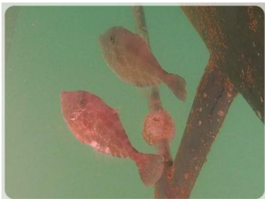
Monsieur et Madame Bourse