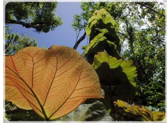
Raisiniers à larges feuilles

Il a tellement plu dernièrement que la végétation est en pleine effervescence et, à notre grand étonnement, il y a des champignons en Martinique.