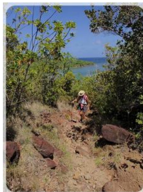
La côte est dure !