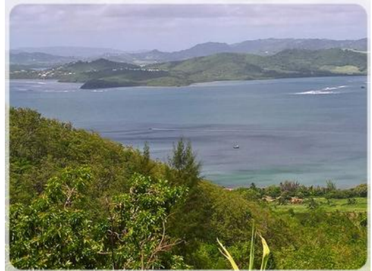
Coucou, je suis là !

Nous rencontrons un couple de Martiniquais qui ont l'air étonné de nous voir prendre le chemin qui mène à leur habitation. Ils nous demande où nous allons. « vers La Baie de Gros Jean » nous leur répondons. « le chemin est difficile à trouver, il faut connaître... ». « Ne vous inquiétez pas, on a le GPS ». « Ah, si vous avez un GPS, alors, tout va pour le mieux... J'ai travaillé pendant 41 ans à Marseille, je connais bien la Métropole »... une discussion s'installe, nous échangeons ensemble quelques mots... vraiment sympa ces braves gens.