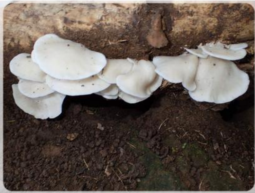
Mangez moi, mangez moi,...

Il a tellement plu dernièrement que la végétation est en pleine effervescence et, à notre grand étonnement, il y a des champignons en Martinique.