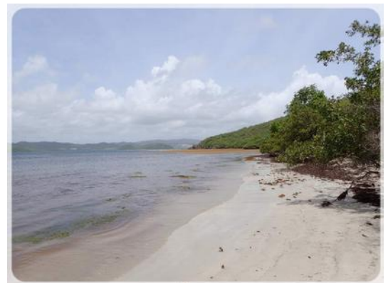
La plage de la Baie Gros Raisins