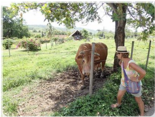
Même pas peur !!!