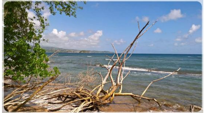
A la Pointe Rouge