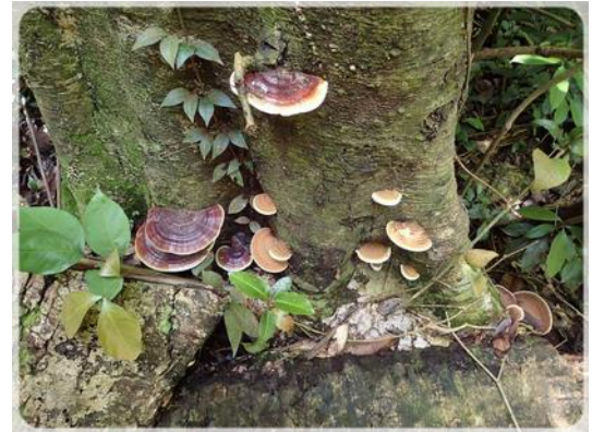
... mangez moi ♪ ♪ ♪