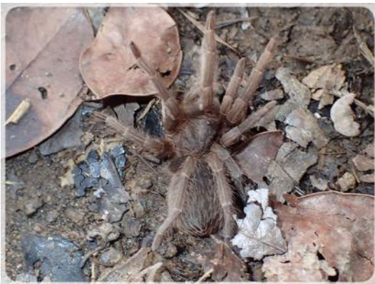
Mygale terrestre de Martinique ou Matoutou des Falaises

Cela me rappelle la fois où je m'étais fait piquer au mollet par ce type de guêpe en Guyane Française provoquant ainsi une douleur intense pendant une bonne demi-journée.