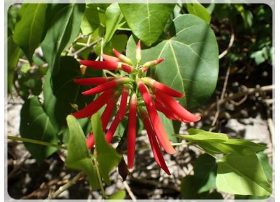
On a pas pu trouvé le nom de cette fleur...

- Lundi 14 mai 2018 : à tous nos amis navigateurs et randonneurs, encore une petite randonnée sympathique à ne pas manquer, celui de La Pointe Rouge située à côté de Tartane.