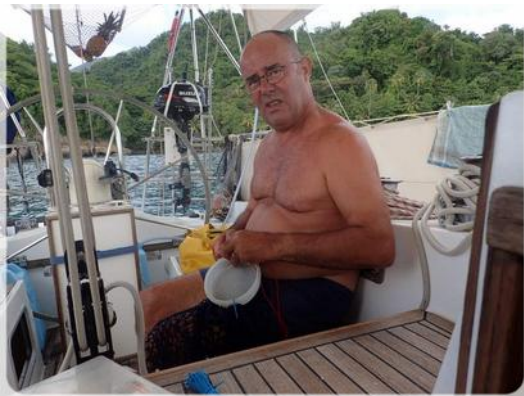
Fabrication d'un filet à langouste...